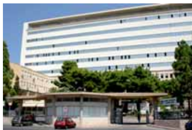
"S. Antonio Abate" di Trapani