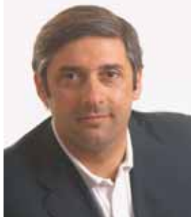
On. Toni Scilla Deputato Regionale

«Circola voce che il governo siciliano, per evitare di sfiorare il patto di stabilità, abbia deciso di bloccare la spesa regionale oscurando di fatto il bilancio. Addio peronospera e fondo di solidarietà per gli agricoltori? Mi auguro che questa scelta non comporti dannose conseguenze verso l'agricoltura, settore strategico e fondamentale per l'intera economia isolana. Non lo permetteremo, siamo pronti a fare anche le barricate. Abbiamo lavorato in Assemblea Regionale durante l'approvazione dell'ultima finanziaria, per ridare dignità ad un settore spesso oggetto di speculazione e di inganni. Grazie alla sinergia tra gli allora assessori Bufardeci e Cimino ed ancora il mio gruppo politico siamo riusciti ad impegnare 30.000.000,00 di euro per pagare la peronospera e ad avviare tante altre iniziative a sostegno del settore. Entro dicembre questi soldi devono arrivare nelle tasche degli agricoltori, non tollereremo nessun tipo di ritardo». A dichiararlo è l'On. Toni Scilla, appresa la notizia della decisione della giunta del blocco temporaneo della spesa.