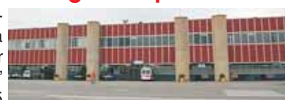
Aeroporto di Birgi

L'aerostazione "Vincenzo Florio" dell'aeroporto di Trapani - Birgi, è stata utilizzata come set cinematografico per le riprese del film "Transeurope Hotel" di Luigi Cinque. Prodotto dalla MRF5 Film e dalla Rossellini Film & Tv di