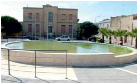
C/da Costiera - Piazza del Popolo