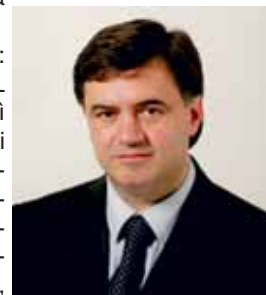
Sen. Antonino Papania