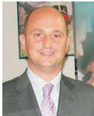
Mimmo Turano Pres. Prov. di Trapani

Una iniziativa di grande respiro, oggi più che mai attuale, riguarda l'istituzione in provincia di una Unità Sanitaria di pronto Intervento Eliotrasportata per l'emergenza in mare, per venire incontro alle esigenze non solo della marineria di Mazara del Vallo, ma alle marinerie dell'intera provincia e dei paesi che si affacciano nel Canale di Sicilia, quotidianamente attraversate da natanti di ogni parte del mondo. Altro argomento, è quello di sottoporre al Presidente della Provincia il problema riguardo il sito archeologico di "San Nicolò Regale" di Mazara del Vallo e del suo sottostante museo, che ormai pronto da diversi anni, il quale ad oggi non è riuscito a decollare ed essere a disposizione di quanti, cittadini e turisti ne fanno quotidianamente richiesta di visitare. Il Centro rimane sempre un punto di emanazione di idee e di iniziative per migliorare il territorio mazarese e della Provincia Regionale di Trapani.