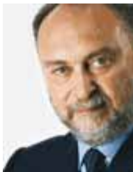
Sen. Antonio D'Alì

complementarietà dei ruoli formali. Non c'è alcuna gara, nessuna primogenitura, nessuna conflittualità come alcuni vorrebbero attribuirci, forse memori e orfani di recenti vicende che, però riguardano altri esponenti oggi approdati ad altre formazioni».